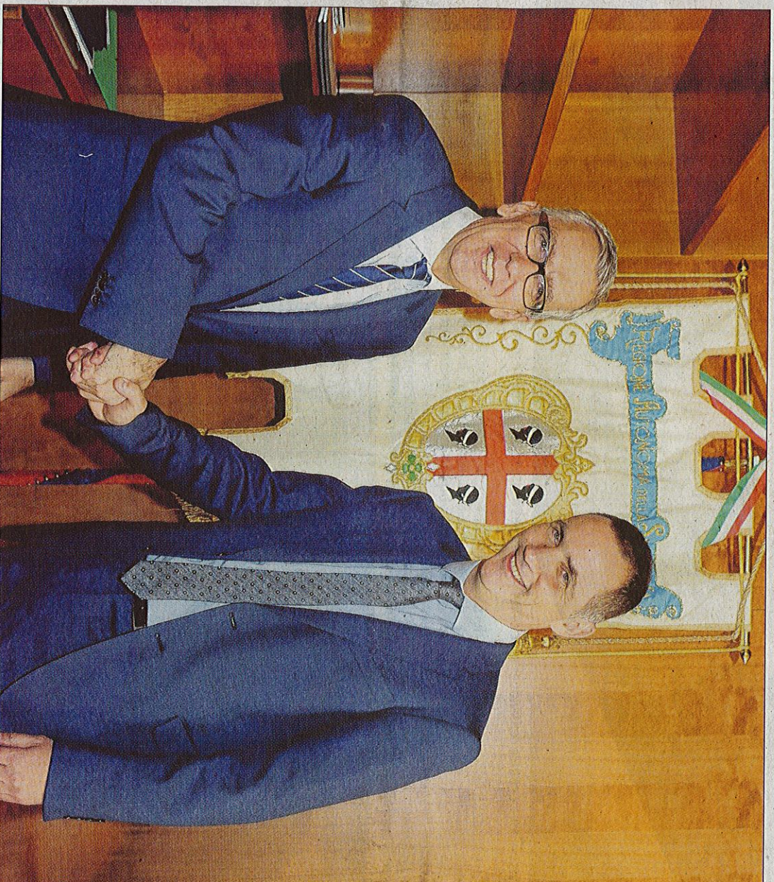
Un superbe accueil pour Gilles Simeoni par le président Francesco Pigliaru.

La rencontre officielle entre les deux exécutifs insulaires s'est déroulée vendredi à Cagliari, la capitale sarde, de 150 000 habitants, dans le sud de l'île. Dans la matinée, la délégation corse était reçue par le conservateur du musée archéologique de la ville. Une visite guidée mettant en exergue les liens ancestraux et patrimoniaux des deux îles autrefois réunies à l'ère préhistorique. A 10 heures, le cortège de voitures s'est rendu au siège de la présidence de la région autonome. La délégation corse était attendue en haut des marches de la très chic Villa Delvoto, entourée de palmiers, par le président Francesco Pigliaru et ses conseillers. Le président sarde est un homme fin, élégant, de centre gauche, proche de Matteo Renzi et pro-européen. La Sardaigne, explique-t-il, souffre de son insularité qui l'isole. Il souhaite une union de plusieurs îles méditerranéennes, avant tout de la Corse et de la Sardaigne mais aussi des Baléares,